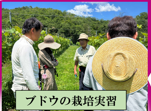
ブドウの栽培実習