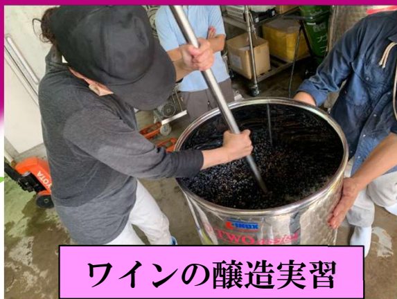
ワインの醸造実習