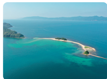
北陸のハワイ「水島」