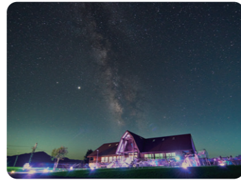
六呂師高原の星空