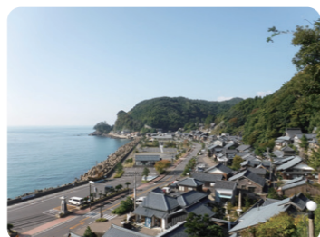
日野川北前船主通り