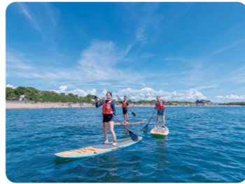
三国サンセットビーチ