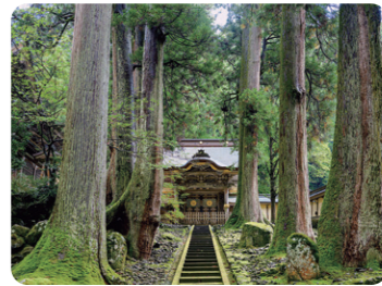
大本山永平寺(唐門)