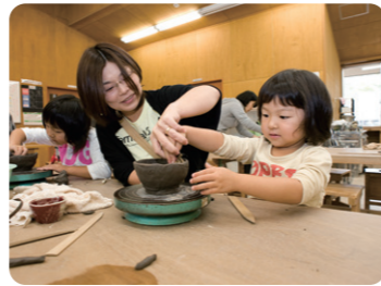
金津創作の森美術館