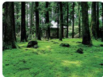
国史跡白山平泉寺