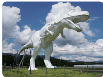
街のシンボル「ホワイトザウルス」