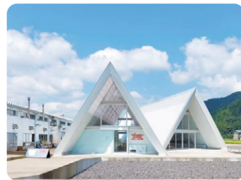
タケフナイフビレッジ