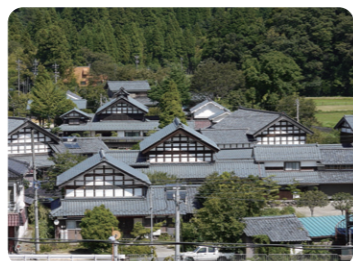
宮崎地区の切妻屋根、白壁づくりの街並み (伝統的民家群保存活用地区)