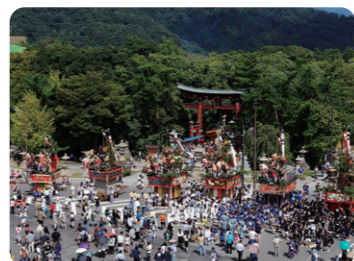
敦賀まつり (氣比神宮)