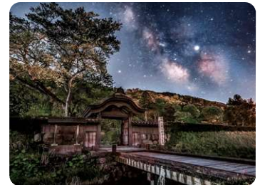
一乗谷朝倉氏遺跡（唐門）