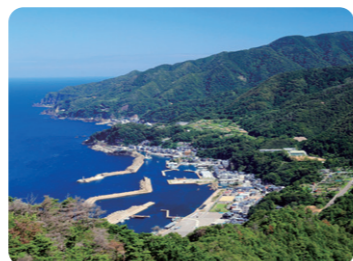
1年を通して新鮮な魚介類が楽しめる「越前海岸」