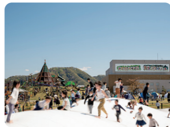
武生中央公園 (だるまちゃん広場)