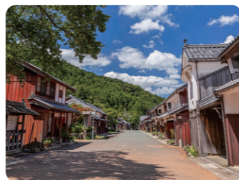
若狭鯖街道 熊川宿